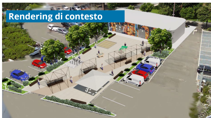
Rendering di contesto

Ci sono 3 porte (una coperta da un piccolo riparo in alluminio), 2 prese d'aria e una manichetta antincendio. Il murale dovrebbe considerare tutti questi elementi come vincoli.